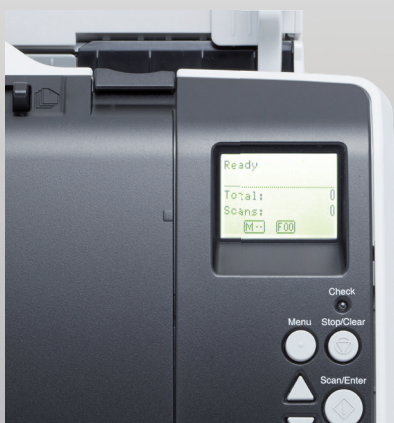
Panneau de contrôle intégré avec écran LCD rétroéclairé

Un écran LCD rétroéclairé sur le panneau de contrôle affiche des informations en temps réel, notamment les paramètres du scanner, l'état de fonctionnement et le compteur de papier. La sélection sur le tableau de bord des routines de numérisation prédéfinies avec la solution puissante PaperStream Capture, incluse dans l'offre, est un jeu d'enfant.